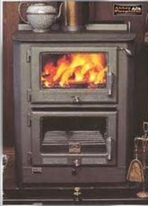
Peči na trdna goriva, naftne derivate (kurilno olje, bencin, petrolej)