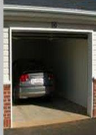
Motorji z notranjim zgorevanjem

V prostoru pride v največ primerih do nastanka prevelikih koncentracij CO zaradi: