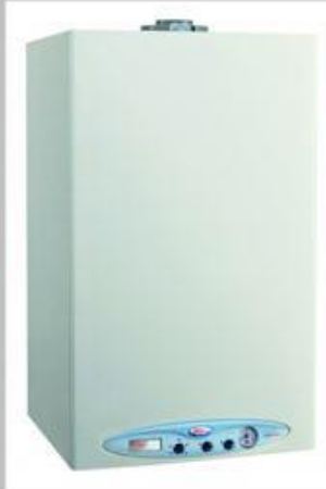
Plinske peči in bojlerji